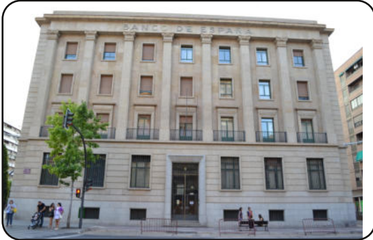
Sede de la Dirección General de Salud Pública, Consumo y Cuidados

Cumplimos un año de compromiso con la ciudadanía riojana